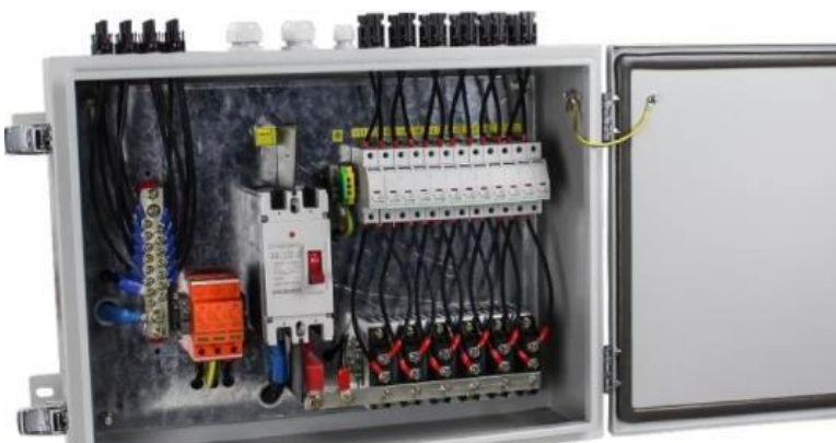
BJ ( BOITE DE JONCTION )